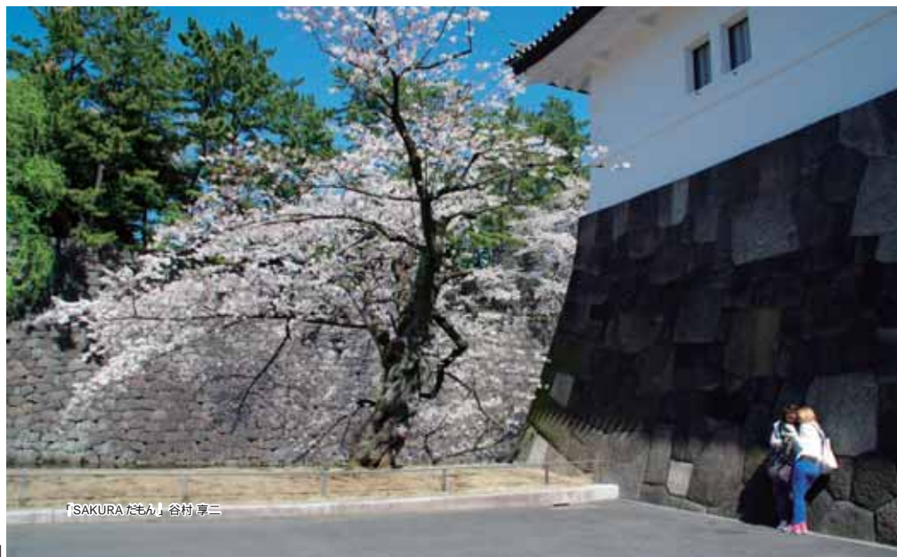
「SAKURA たもん」谷村 享三