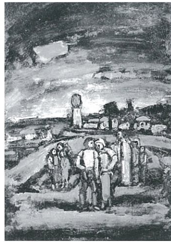
たそがれ あるいは イル・ド・フランス 1937年