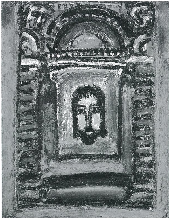
《受難》1 受難 1935年