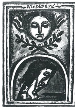
《ミセレーレ》1 神よ、われを憐れみたまえ、あなたのおおなる慈しみによって 1923年 展示期間：10月24日(土)～11月15日(日)

20世紀を代表するフランスの画家、ジョルジュ・ルオー(1871-1958)。重厚なマティエールと透明な輝きに包まれた神秘的な光の描写を特徴とし、敬虔なカトリック信者としての信仰に根ざした深い精神性をたたえた作品は、国や時代、信仰の違いを越えて多くの人々を魅了してきました。人間の苦悩、愛や希望を鋭く描き出したルオーの崇高で深遠なる世界を出光コレクションより厳選した作品でご堪能ください。