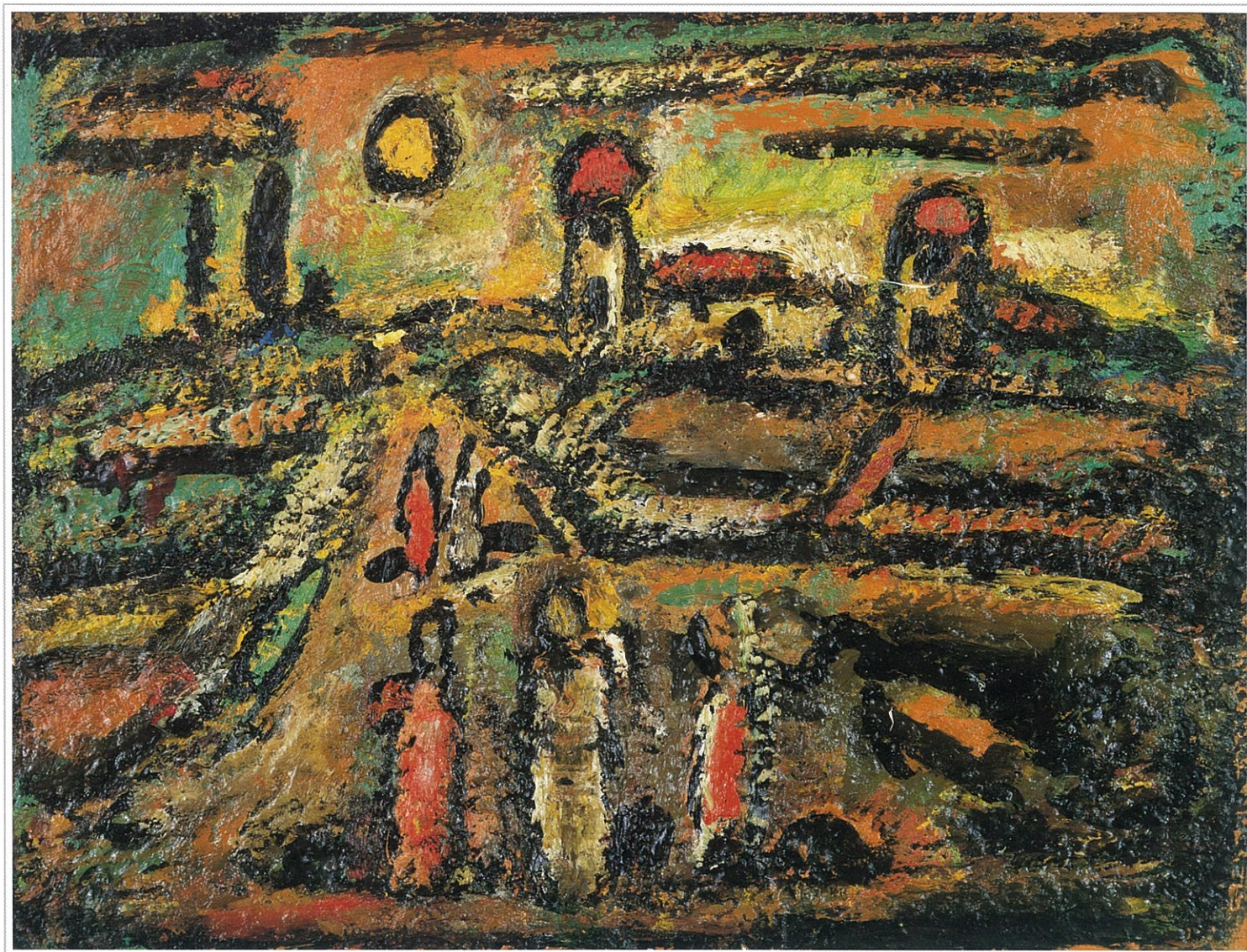
聖書の風景 ジョルジュ・ルオー 1953-56年